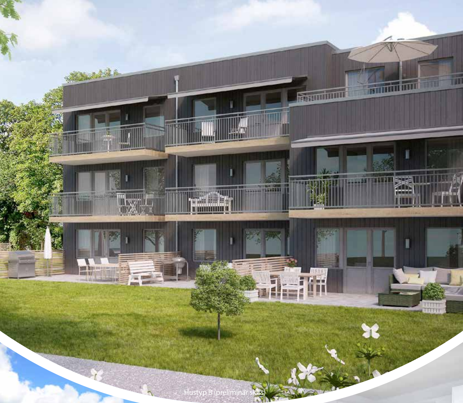
Hustyp B (preliminär skiss)