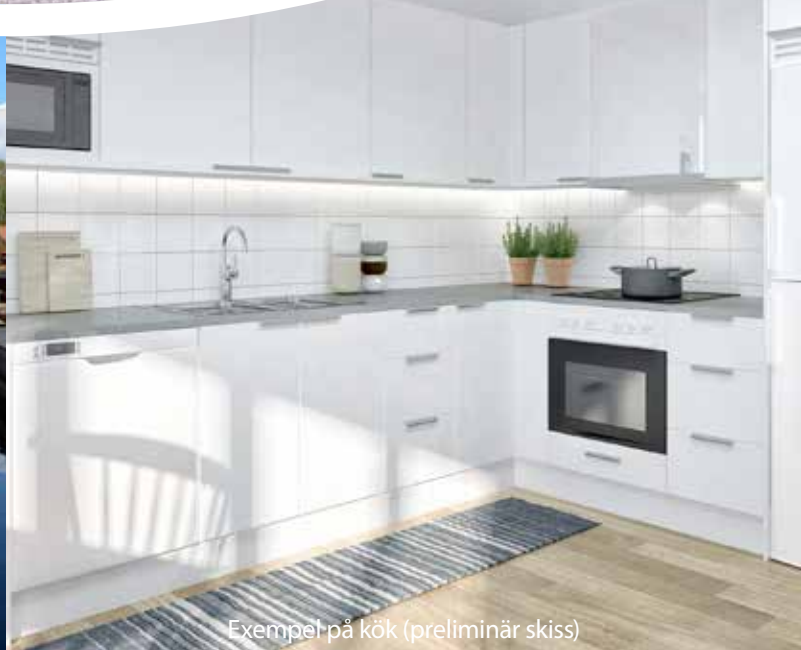
Exempel på kök (preliminär skiss)